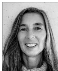
Iris Urbaniak Street-Fotografin