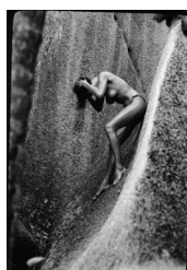
Cover: Hans Lux, Courtesy: Galerie noir blanche