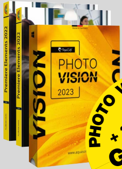
PHOTO VISION 14 + 2 E-Books GRATIS! statt zus. 76 € (ehem. UVP) * FHM-ARCHIV 2025