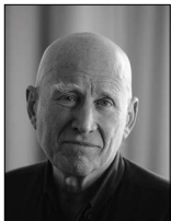
Seb. Salgado Eine Legende