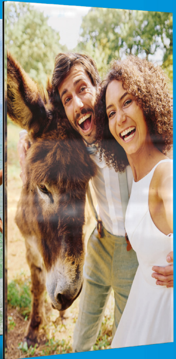
Foto als Galerie-Print