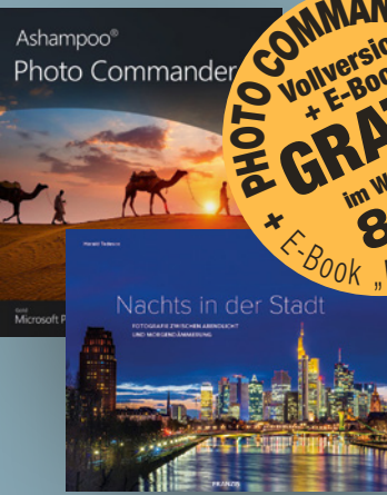
PHOTO COMMANDER 17 Vollversion + E-Book GRATIS im Wert von 80€! + E-Book „Nachts in der Stadt“