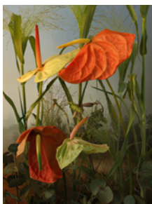
Titelbild: Tine Poppe