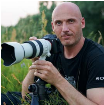
Petar Sabol Professioneller Naturfotograf

„LEICHT, ULTRASCHARF UND VIELSEITIG – DIESES TELEOBJEKTIV MIT MAKROFUNKTION IST EIN GROSSARTIGES OBJEKTIV FÜR NATURAUFNAHMEN, SPORT UND PORTRÄTS.“