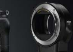
BAJONETT-ADAPTER FTZ kompatibel mit allen F-Bajonett-Objektiven

*Bis zu 1.000,00 EURO gratis! (Nur SUN-SNIPER, wenn Ihr Gürt durchgeschneidert und die Kamera gesichert wurde. Bedingungen unter: www.sun-sniper.com . Dies ist eine für Sie kostenlose Vereinbarung der SUN-SNIPER GmbH.