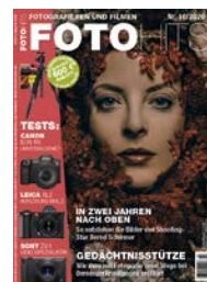
Cover: Bernd Schirmer Model: Nina Rosentreter Headpiece: Melanie Plum