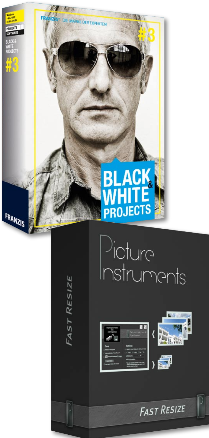
FOTO HITS-Leser erhalten mit dieser Ausgabe die beiden Vollversionen „ BLACK & WHITE projects 3 “ von Franzis und „ Fast Resize “ von Picture Instruments. Die Softwares werden ab Seite 10 ausführlich vorgestellt. Käufer der Printausgabe finden eingeklebt im Heft eine kleine Karte, die einen individuellen Zugangs-Code bereithält.

Unsere E-Paper-Leser erhalten ihre Codes auf zwei Wegen: